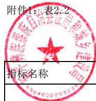
项目绩效目标表（绩效目标）